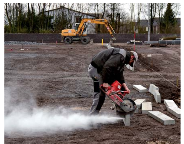
Die vorerst letzte Maßnahme der Modernisierungs-Maßnahmen: der Umbau des Sportplatzes in Gruiten mitsamt der Turnhalle, die auf dem mittleren Bild im Hintergrund zu sehen ist.