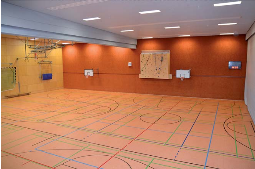
Die Sporthalle Walderstraße: mit den Sportlern vieler Vereine und den Schülern der Haupt- und Realschule die am meisten genutzte Halle.

An einer Herkulesaufgabe mit Erfolg beteiligt: die Modernisierung der Sportanlagen in Haan