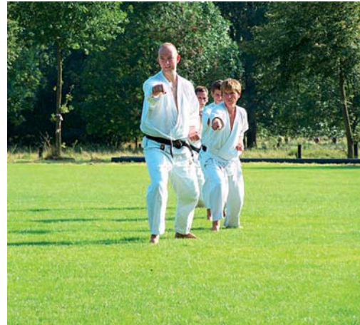
Es geht nicht um Action, sondern um Geduld und Konzentration.

ken immer wieder geübt. Beim Kumite werden die Techniken mit dem Gegner umgesetzt. Als Katas bezeichnet man traditionell überlieferte Bewegungsabläufe in einer festgelegten Rei-