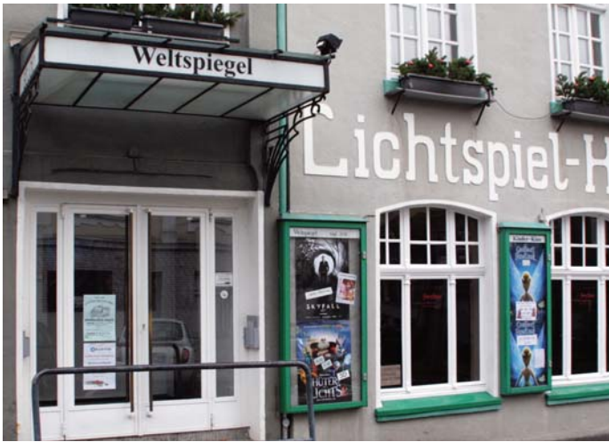
Im Mettmanner Kino an der Düsseldorfer Straße 2 wird das ganze Jahr über für Jung und Alt ein aktuelles und ansprechendes Programm geboten.