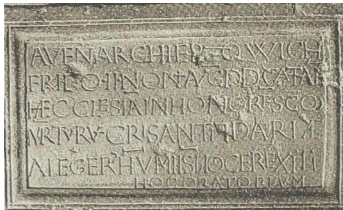
Der alte Inschriftenstein befindet sich heute in der evangelischen Kirche in der Kaiserstraße.