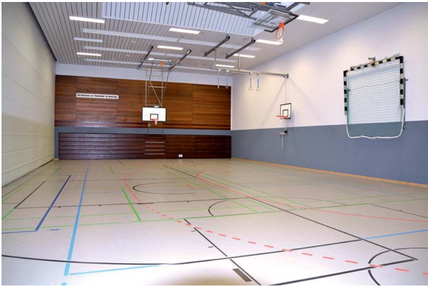
Erstrahlt in neuem Glanz: die Sporthalle Adlerstraße, die auch die sportliche Heimat der Unitas-Handballer ist.