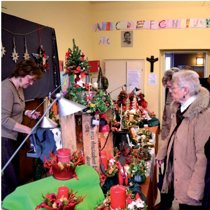
Gut besucht war der Handwerkermarkt. Die Schul-Konrektorin zeigte sich gegenüber dem Stadtmagazin sehr zufrieden mit der Resonanz.

Am 18. November 2012 fand, bei leider nicht gerade überragendem Wetter, wieder der große, traditionelle Handwerkermarkt der katholischen Don-Bosco-Grundschule in Haan statt. Schüler, Eltern, Lehrer und Förderverein stellten erneut ein buntes Programm auf die Beine.