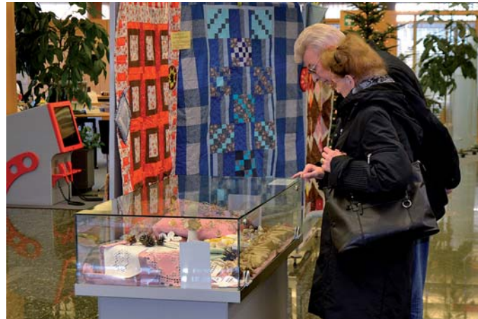
Ausstellung in der Sparkassenhauptstelle.