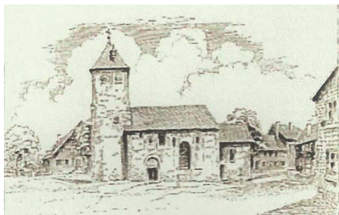
Die alte Kirche wurde mehrmals umgebaut und im Jahre 1863 abgerissen.

des im Jahre 1974 ausgestellt. Zur Präsentation der Schläfenringe, die ebenfalls gefunden wurden, diente ein Plastikkopf mit blonder Perücke. Einige Fundstücke galten als verschwunden. „Auf der Suche danach wurden regelrechte Verhöre unter Mitarbeitern der Stadtverwaltung angestellt“, so Birgit Markley. Gefunden wurden sie offenbar nicht.