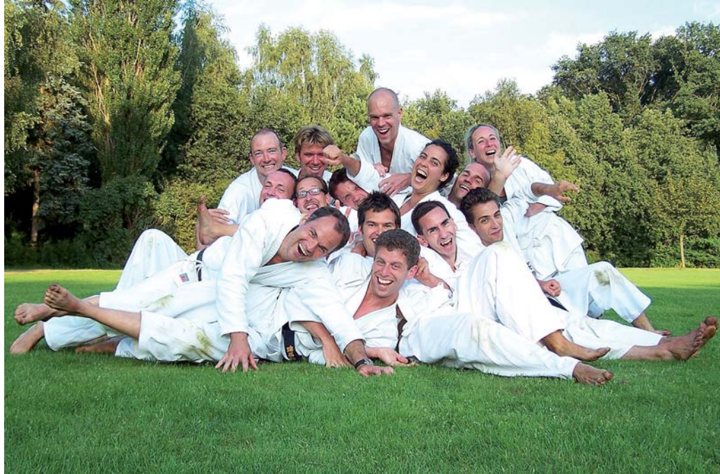
Im Sommer wird auch schon mal unter freiem Himmel trainiert. Übrigens: „Dojo“ nennt man die Übungshalle für japanische Kampfkünste.

Das Training besteht daher im Wesentlichen aus drei Elementen. Im Kihon werden die einzelnen Angriff- und Abwehrtechni-