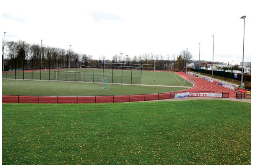
Ein Meilenstein: die Sanierung des Sportplatzes Hochdahler Straße mit einem neuen Kunstrasen und einer Kunststofflaufbahn.

Die Sportverbände der zehn Städte im Kreis Mettmann nehmen in der Sportpolitik und damit auch in der Kommunalpolitik eine zentrale Position ein. Die Lösung wichtiger Fragen und Entscheidungen zum Thema Sport ist ohne die Mitarbeit der Sportverbände heute nicht mehr denkbar. In Haan ist der Sportverband bereits seit knapp 60 Jahren für die Sportvereine der Gartenstadt tätig und vertritt die Interessen der Haaner Sportklubs gegenüber allen Institutionen.