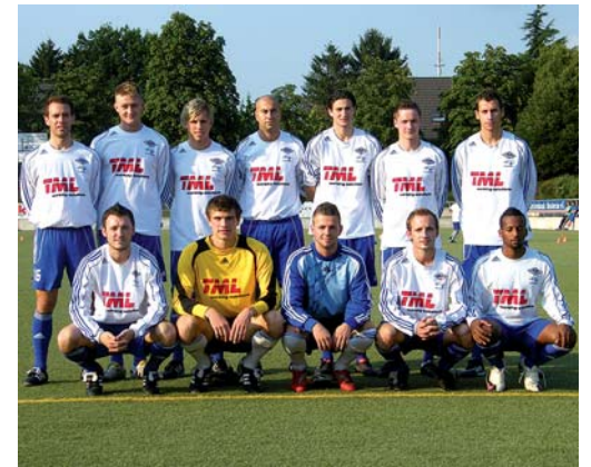
Fast eine komplette Mannschaft: Zwölf der insgesamt 14 Neuzugänge der Sportfreunde Baumberg.

ser Saison optimistisch entgegen blickt. „Es dauert noch, bis ein Rädchen ins andere greift. Doch wir haben eine realistische Chance.“