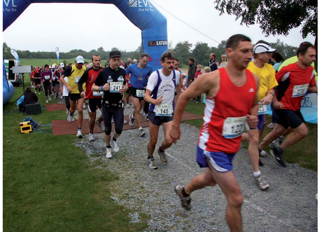
Für Profis und solche, die es noch werden wollen: Beim 50 km-Lauf um den Hitdorfer See kann jeder Läufer seine Strecke individuell bestimmen - von fünf bis 50 Kilometern.

Jeder Sportler braucht auch die richtige Ausrüstung. Darum bie-