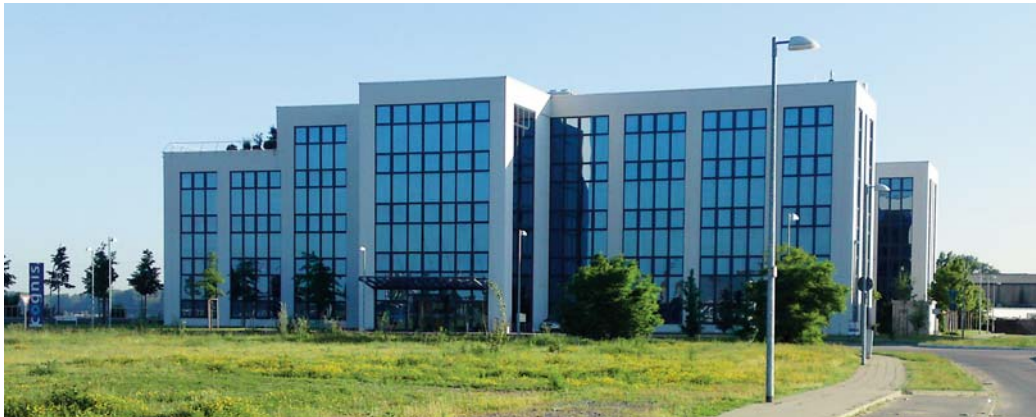
Cognis in Monheim am Rhein.