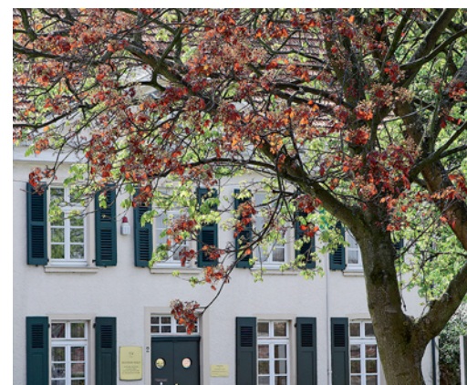
Das Deusserhaus war zu Beginn des vergangenen Jahrhunderts Wohnstatt des Malers August Deusser.

gleichsam das Signal eines römischen Hornisten. Denn mit dem Blick auf 1600 Jahre römisches Bürgel fällt der Startschuss quasi zu Zeiten des römischen Reiches. Danach geht's Schlag auf Schlag. Chronologisch blättert man sich entlang der Ausstellungsstücke durch die Geschichte einer Stadt und ihrer Umgebung.