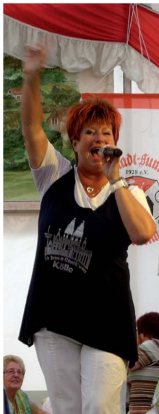
Gesungen und getanzt wurde beim Schürefest...