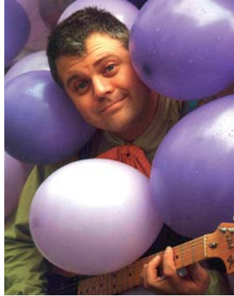
„Der Krachmacher“: 22. und 23. September.