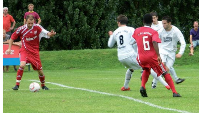
Vergeblicher Sturm: Im ersten Heimspiel gegen TuRU II berannten die Monheimer (rote Trikots) ohne Erfolg das Tor der Gäste.