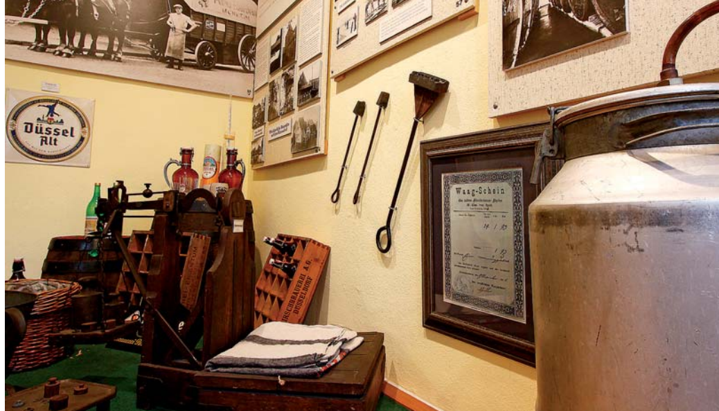
Der historische Startschuss fällt bei Haus Bürgel, danach geht's Schlag auf Schlag durch die Stadtgeschichte.

Zur Einführung in die heimatkundliche Sammlung ertönt