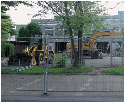
Umbauarbeiten an der Realschule.

An dieser Stelle werden lokale Ereignisse dokumentiert, die in der Stadt in den letzten Wochen für Gesprächsstoff sorgten und/oder in Zukunft noch sorgen werden