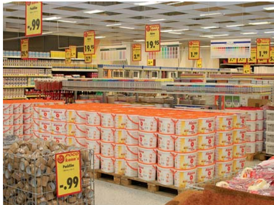
POCO bietet ein reichhaltiges Angebot - nicht nur zur Renovierung.