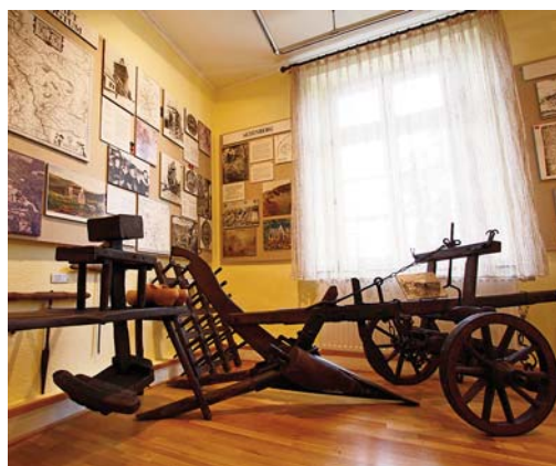
Die heimatkundliche Sammlung umfasst auf zwei Etagen mehr als 4000 Exponate.