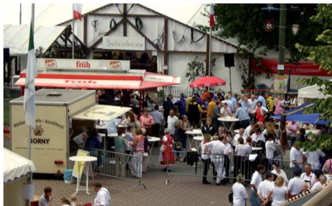
Blick aufs Schürefestgelände.