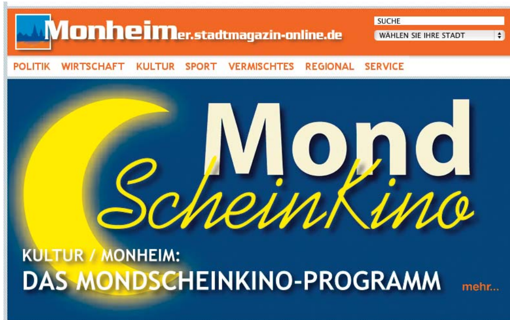
Die großen Topnews-Fotos bleiben in der Regel mehrere Tage oben stehen. Um den Artikel zu lesen, brauchen Sie nur auf das zu Bild klicken.