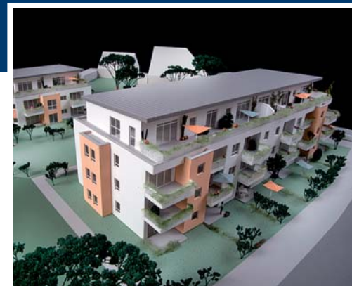
Hochwertige Eigentumswohnungen präsentiert die Furthmann Massivhaus GmbH.