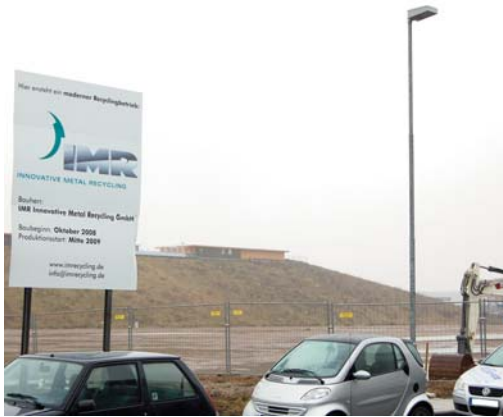
Vergangenheit – IMR in Monheim.