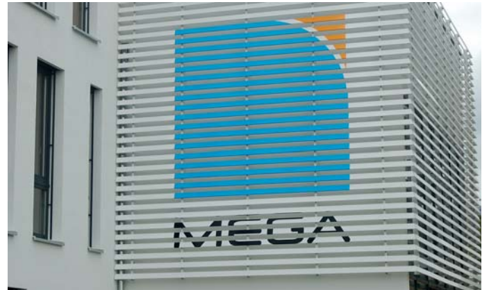
Das neue MEGA-Gebäude.