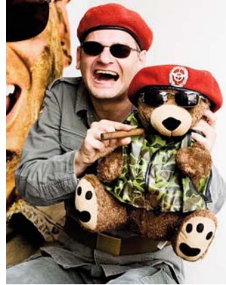
„Zum Brüllen komisch“: 2. Oktober.