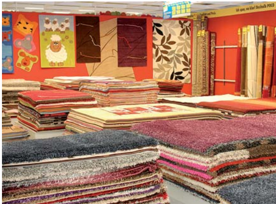
Das Angebot reicht von Elektroartikeln, Geschenkartikeln, Haushaltswaren und Heimtextilien über Küchen und Möbel bis hin zu Tapeten, Teppichböden und Teppichen.

Am 6. September eröffnet der neue POCO-Einrichtungsmarkt