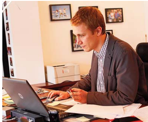
Der Bürgermeister will mit den Altstadtwirten Optimierungspotentiale ausloten.