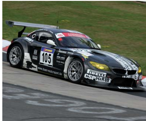
Schwarz und schnell...