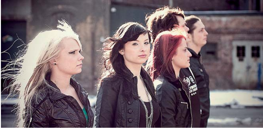
Revolving Door aus Thüringen haben als Schülerband angefangen und mittlerweile über 300 Gigs gespielt.

Auf zwei Bühnen präsentieren sich am 11. September zehn Newcomerbands