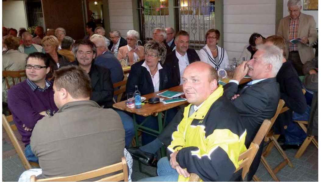
Viel Politprominenz sah man beim Sommerfest am Garather Weg.