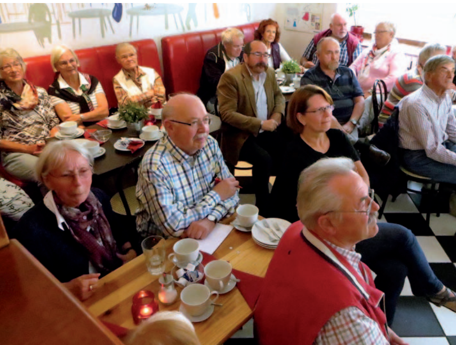
Die SPD-Senioren beim „Treff am Nachmittag“.

Von SPD bis CDU, über Grüne und Europa-Union