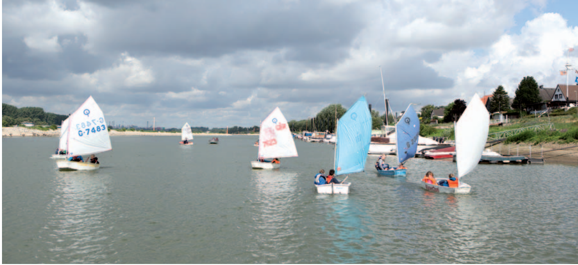
„Optimisten“ im Einsatz: Die YCWH-Jugend mit ihren kleinen Segelbooten bei einem Training im Hitdorfer Hafen. Die Kinderboote, die „Optimist“ genannt werden, sind Einhand-Jollen, mit denen die Nachwuchsegler den Sport kinderleicht erlernen.