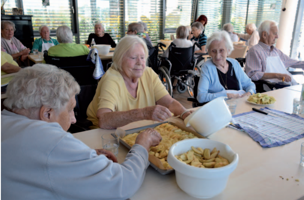
Mit Eifer waren die Senioren des St. Marien Altenheims beim Backen dabei.

Die Bewohner des St. Marien Altenheims wollen den Flüchtlingen helfen