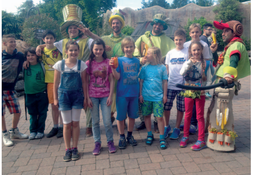
Ausflug zu Lande: Die Jugend des Yacht-Clubs Wuppertal-Hitdorf unternimmt auch außerhalb des Wassers viel gemeinsam. Hier bei einem Ausflug ins Phantasialand.

Für die Jugend des Clubs ist die Opti-C Regatta (Boote sind nicht vermessen) im Hitdorfer Yachthafen, die stets am letzten September-Wochenende auf dem Programm steht, ein großes Highlight der Segelsaison. Diesmal wurde die Nachwuchs-Regatta