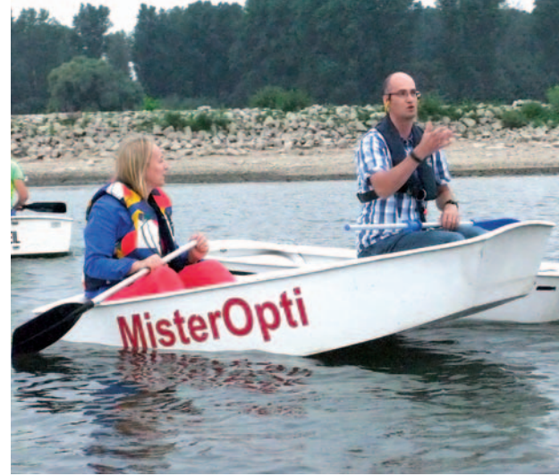
Ein „Optimist“ für die Großen: Auch die Eltern der Kinder konnten beim Hafenfest erste Erfahrungen zum Segeln sammeln.