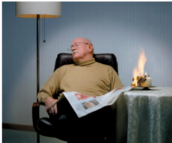
Ein älterer Mann schläft beim Zeitunglesen ein und löst einen Brand durch die Kerze aus.