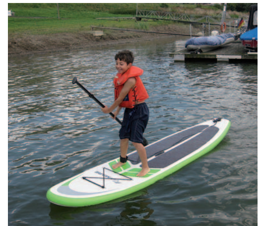
Ein neues Hobby: Auch das Stand-Up-Paddling, kurz genannt SUP, bereitet dem Segler-Nachwuchs großes Vergnügen.