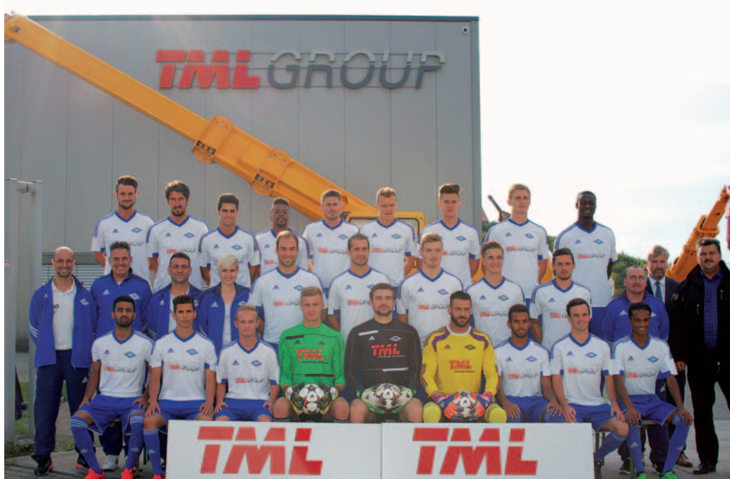
Das Team der Sportfreunde Baumberg für die Landesliga-Saison 2015/16. Die neue Spielzeit lief hervorragend an. Nach acht Punktspielen standen die Sportfreunde ungeschlagen an der Tabellenspitze.