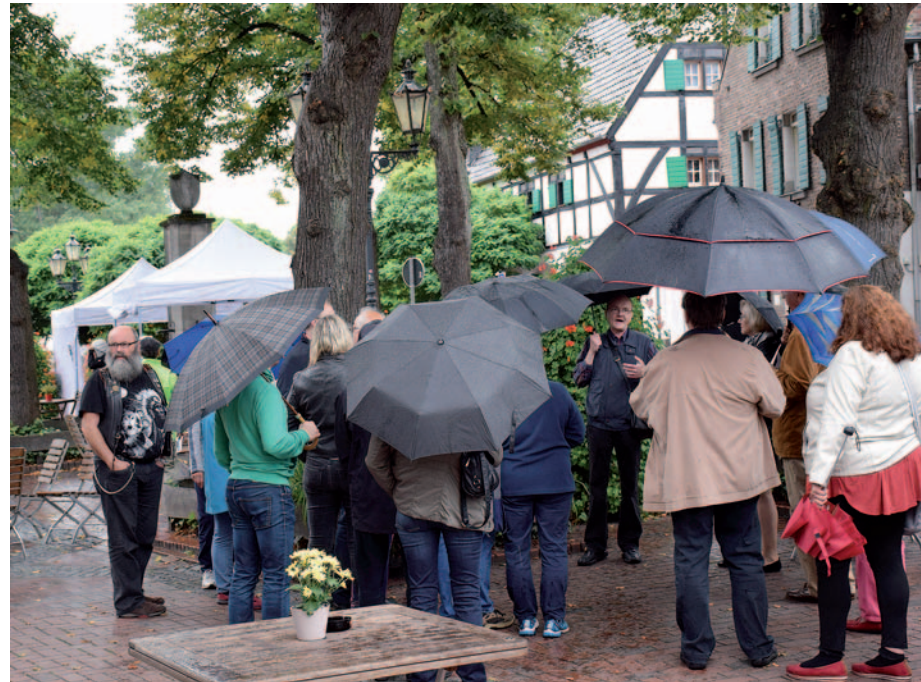
Tag des offenen Denkmals: Blick auf die lange Monheimer Gastronomiehistorie in der Festhalle Bormacher.