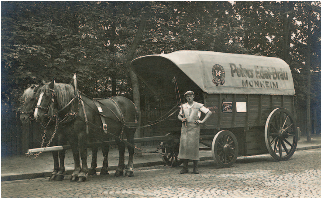
Ein Bild aus früheren Tagen: Mit Pferdewagen wurde das Bier ausgefahren.