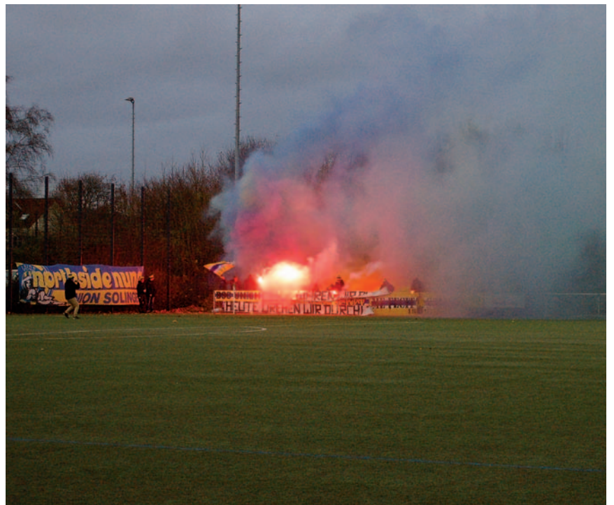
Spielabbruch möglich: Wenn Fans Bengalos zünden, kann der Unparteiische die Mannschaften in die Kabinen schicken. Hier zündeln Anhänger des BSC Union Solingen beim Gastspiel im Reusrather Sportpark.

Fouls, Schläge, Platzverweise oder sogar Spielabbrüche – wenn die hässliche Seite des Fußballs zum Vorschein kommt, ist die Sportgerichtsbarkeit der Fußballverbände gefragt. Beim Fußballkreis Solingen (Kreis 2), der für die Vereine in Solingen, Langenfeld, Monheim, Haan und Leichlingen sowie einiger Klubs aus Leverkusen zuständig ist, befasst sich die Kreisspruchkammer mit Rechts- und Verfahrensfragen, die sich aus dem Spielbetrieb ergeben. Hierbei ist die Kreisspruchkammer des Fußballkreises Solingen für die Kreisligen, von A- bis C-Liga, verantwortlich.