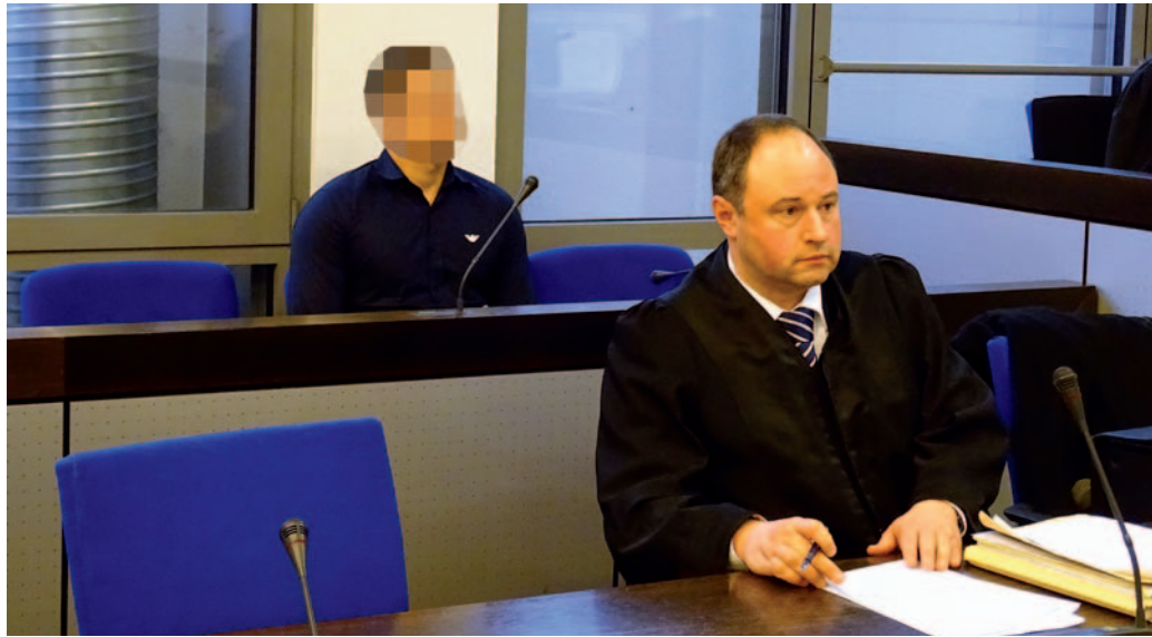
Der 25-jährige Angeklagte muss sich derzeit vor dem Wuppertaler Landgericht wegen versuchten Totschlags verantworten. Er soll die Tat aufgrund einer akuten Psychose begangen haben.

Er habe Dämonen gesehen und bei der Mutter eine Teufelsaustreibung vornehmen wollen, ließ er das Gericht wissen. Mit im Saal: Der sachverständige Gutachter, der den Gesundheitszustand des Angeklagten in den vergangenen Monaten zu beurteilen hatte. In dessen Äußerungen zur Lebensgeschichte des jungen Mannes, dessen Mutter von den Philippinen stammt, wurde vor allem eines augenscheinlich: Die Kindheit war of-