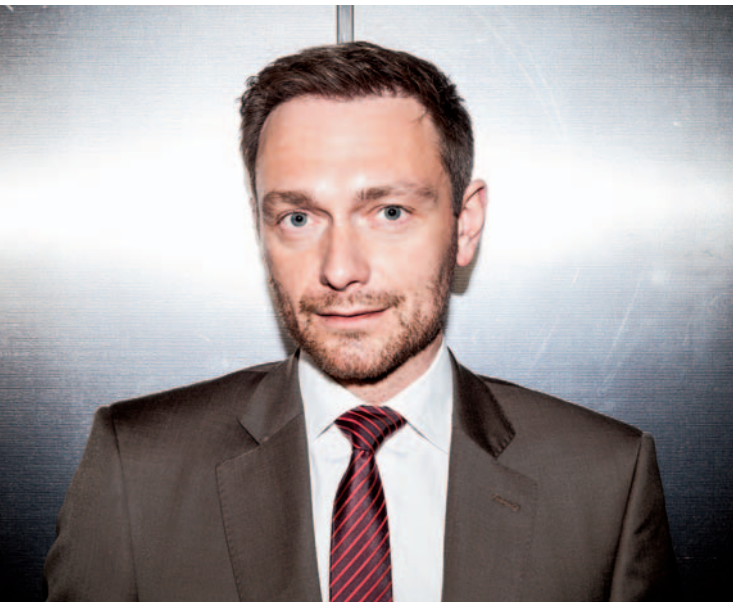
Christian Lindner wird zu Themen, die Deutschland bewegen, mit Bürgern in Monheim diskutieren.