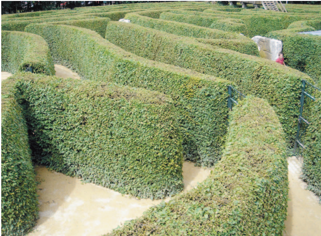
Auch wenn man nicht einen ganzen Irrgarten aus immergrünen Gehölzen hat – einzelne Formgehölze sind ebenfalls etwas Besonderes und vermitteln eine gewisse Noblesse.

lernde Libellen im Sonnenlicht schwirren, quaken Frösche zwischen Seerosen. Ein Teich wird schnell zum Mittelpunkt eines Gartens und lädt zum Verweilen und Erholen ein. Neben Fischen und Insekten gibt es auch eine beachtliche Anzahl von Pflanzen, die sich im und am Teich zu Hause fühlen. Die Situation an Teichrändern und Bächen ist logischerweise gekennzeichnet durch große Bodenfeuchtigkeit, für die sich manche Stauden hervorragend eignen. Besonders die bereits im April und Mai blau bis weißlich blühende sibirische Wieseniris ( Iris sibirica ), die Taglilien, zum Beispiel Hemerocallis