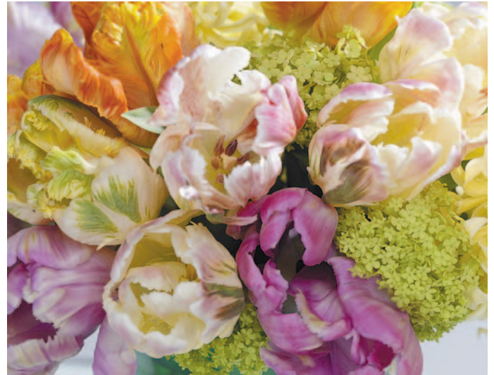
Jedes Blütenblatt der Papageientulpen ist anders und manche sehen aus, als ob die Farben mit einem Pinsel aufgetragen wären.

Die Tage des Winters bald sind gezählt und mit frischen Farben und Frühjahrsvorboten geht es noch schneller. Hier und da zeigt sich erstes zaghaftes Grün. Gerade das Erwachen der Natur ist der Inbegriff des Frühlings: Wie praktisch, dass bereits auf Wochenmärkten, beim Floristen und in Gärtnereien schöne, farbenfrohe Blumensträuße in voller Blüte locken, dazu bereit, wintermüde Gemüter schwungvoll aufzuhellen. Am besten schnell zugreifen, denn typische Frühjahrsblüher wie Tulpen gibt es nur für begrenzte Zeit. Mit ihren frischen und leuchtenden Farben beleben Tulpen jeden Raum und jedes Gemüt. Ihr Farbreichtum ist riesig. Bis auf Blau und Schwarz sind fast alle Töne dabei. Manche Tulpen wie die „Queen of Night“ blühen so dunkel, dass sie fast schwarz aussehen. Andere haben Blüten, deren Farben wie mit einem Pinsel gemalt wirken oder wie Flammen züngeln. Auch bei der Form der Blüten gibt es viele Variationen: von klassisch schmal, ungefüllt und länglich bis zu opulent gefüllten Blüten, die mit ihrer