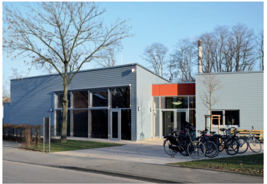
Die neue Kita wurde in Holzrahmenbauweise errichtet. Auf dem Dach befindet sich eine Solaranlage.