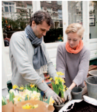
Erste Sonnenstrahlen locken in den Garten: Die Pflanzzeit hat begonnen.