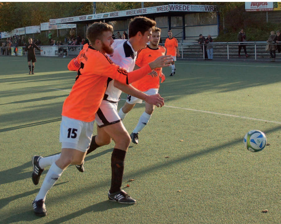
Hart umkämpfte Zweikämpfe: Manche bleiben nicht ohne Folgen und ziehen eine Verhandlung vor der Kreisspruchkammer nach sich. Hier aber ein faires Duell der Kreisliga A im Derby zwischen TuSpo Richrath und der Zweitvertretung des SSV Berghausen.

Sperren, Spielabbrüche und Regelverstöße: Warum die Schiedskommission sich trotzdem über ein verbessertes Verhalten der Kreisliga-Kicker freut