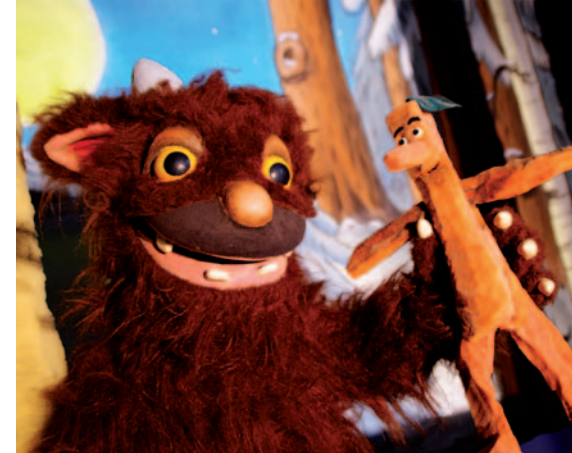
Pulcinella Puppentheater: „Das Grüffelokind“.