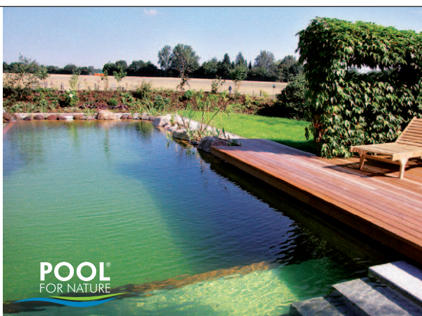
POOL® FOR NATURE

Jürgen Olbrich Garten- und Landschaftsbau Kirchkuhle 4 40789 Monheim-Baumberg Fon +49 (0) 2173 6 61 30 Fax +49 (0) 2173 96 31 47 info@olbrich-galabau.de www.olbrich-galabau.de