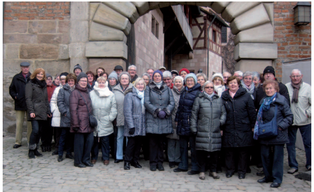
Ende 2016 besuchte die Monheimer SU den Nürnberger Christkindmarkt.