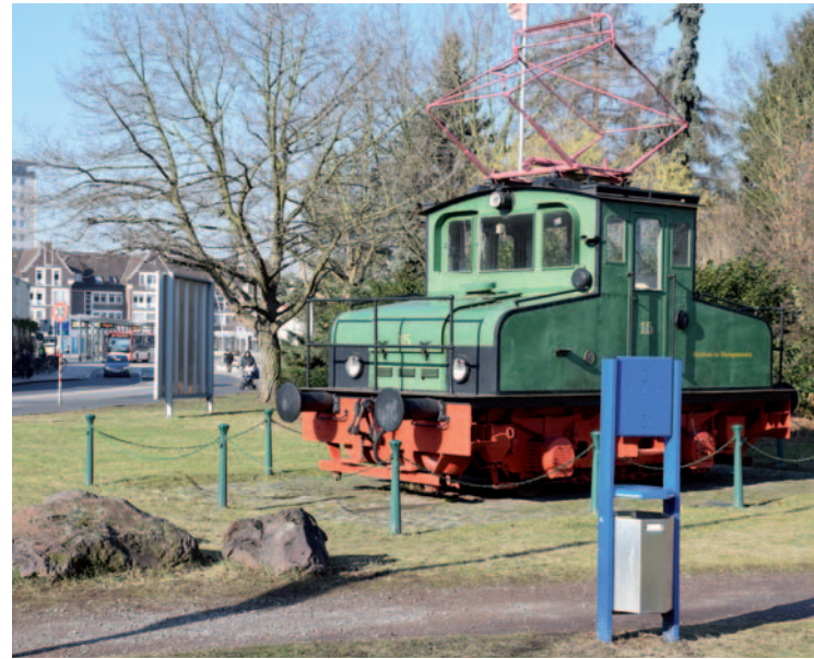
Im gesamten Stadtgebiet können Hundehalter an rund 40 Stationen Hundekotbeutel entnehmen.

anlagen, sondern in den öffentlichen Mülltonnen zu entsorgen. Um der Problematik des wilden Kots, vor allem auf Kinderspielflächen und in Parkanlagen, weiter zu begegnen, plant der kommunale Ordnungsdienst verstärkte Kontrollen. Auch in der Vergangenheit gab es bereits regelmäßige Kontrollen, viele Hundehalter halten sich aber immer noch nicht an die Regeln. Wer bei einem Verstoß erwischt wird, muss mit einem Verwarnungsgeld in Höhe von bis zu 55 Euro rechnen. Bei wiederholten Verstößen ist auch ein Verfahren wegen Ordnungswidrigkeit nicht ausgeschlossen. Auf Straßen, Gehwegen und Parks müssen Hunde stets an der Leine geführt werden. Ausnahmen sind ebenfalls in der Ordnungsbehördlichen Verordnung geregelt. So dürfen Hunde unter anderem an der Baumberger Bonhoefferstraße zwischen Kleingartenanlagen und Holzweg, auf dem